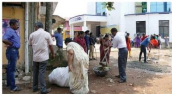
Officials clean the premises of the municipal headquarters in Ponnani during the Suchitwa Hartal on Saturday.

People from all walks of life took to the streets and public places across the divisions as part of the